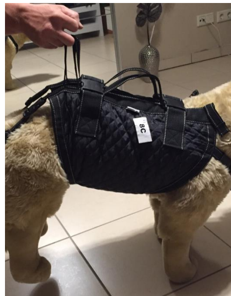
Entlastung der Hinterläufe