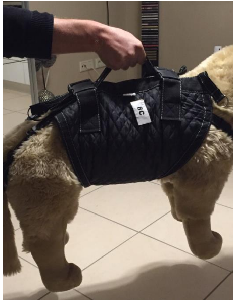
Tragen mittels der Rückengriffe