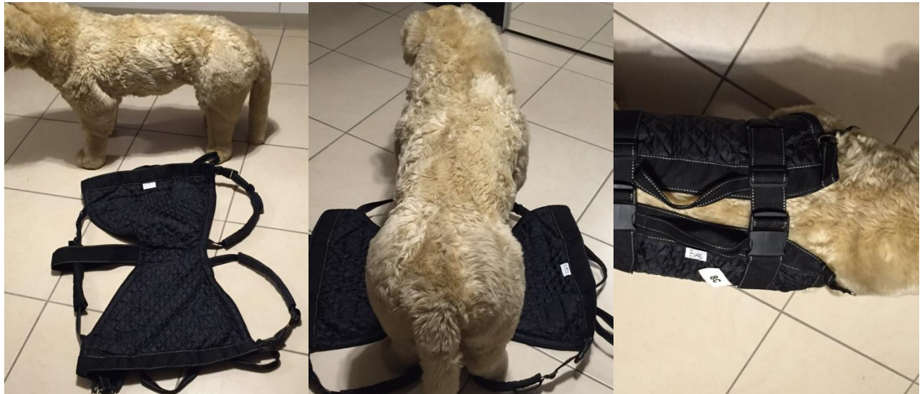
Die gepolsterten Riemen hinten