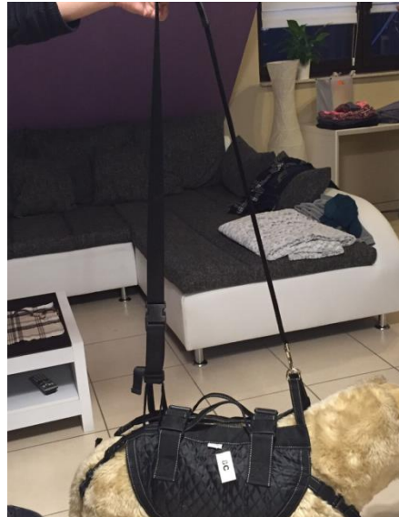
Anlegen des Tragegurtes (separat erhältlich)