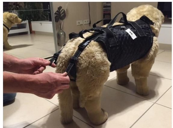
Die hinteren Gurte nicht zu stramm einstellen